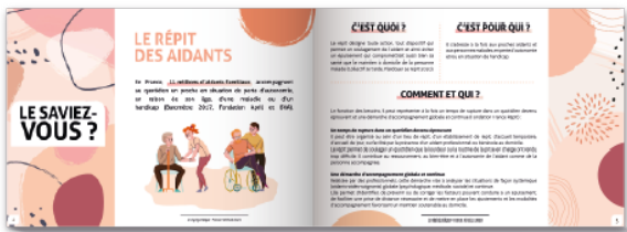
Lire Le Répit Juridique des Aidants

« Le répit juridique : le prévoir, c'est vivre sereinement son répit » : Tel est le message qu'a souhaité faire passer France TUTELLE auprès du grand public en mettant gratuitement cette plaquette sur son site internet.