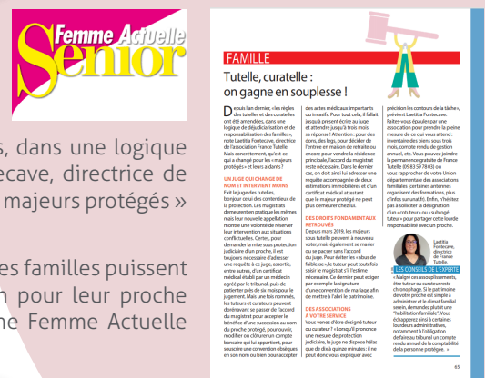
Lire l'article de Femme Actuelle Senior

L'association veut rendre accessible les sujets de la protection juridique pour que les familles puissent mieux comprendre et mieux anticiper les solutions de protection à disposition pour leur proche vulnérable. La journaliste Caroline Racapé nous a ouvert les pages du Magazine Femme Actuelle Senior pour y publier cet article de qualité.